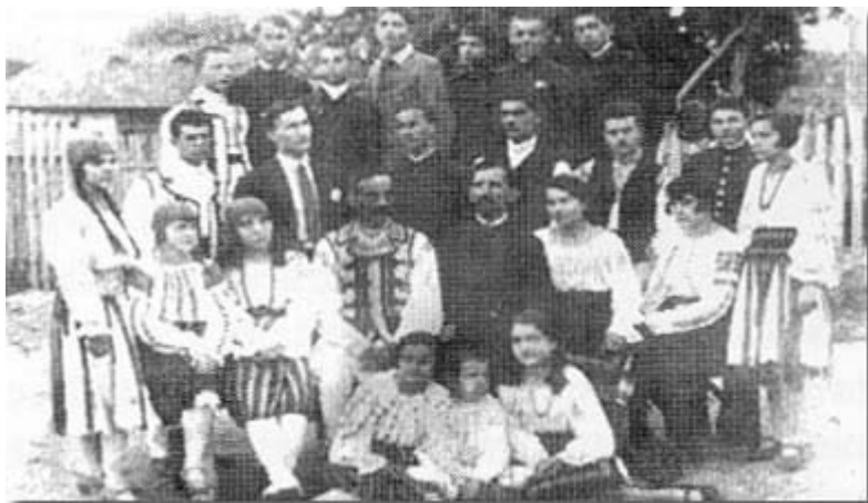
Membrii Societății "Cosânzeana" după un spectacol - 1929

Biblioteca Municipală "Radu Rosetti" continuă, la alte dimensiuni desigur, activitatea Societății Culturale "Cosânzeana". Există în colecțiile actualei Biblioteci numeroase mărturii, extrase din publicațiile seriale ale vremii și fotografii din care se poate constata implicarea societății culturale, înființate în 1928, în viața culturală și artistică a comunei Onești (la acea vreme) prin organizarea unor variate manifestări și activități cu caracter permanent (șezători literare, teatru, recitaluri corale, seri de dans).