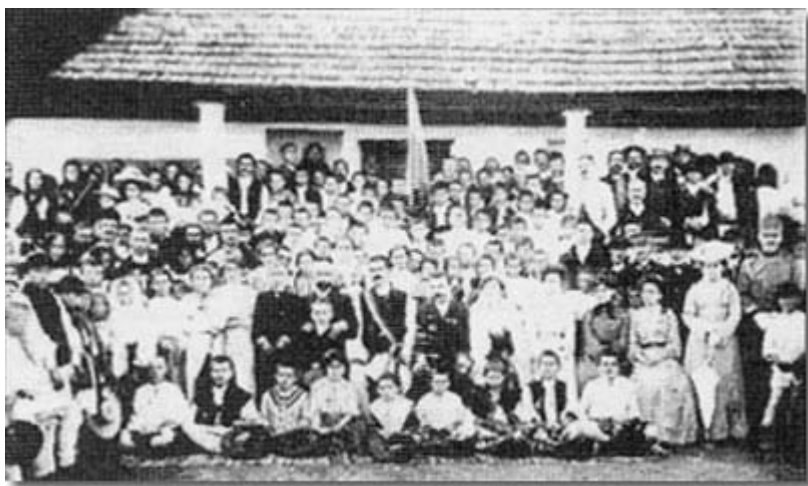
Serbare la Onești - 1930

Astăzi în bibliotecă mai există un număr de 25 volume, constituite într-un fond special, care au făcut parte din colecțiile Bibliotecii Societății Culturale "Cosânzeana", colecții care numărau în deceniul al 3-lea aproximativ 700 volume. Resursele necesare dezvoltării colecțiilor de bibliotecă erau obținute prin organizarea de spectacole și serbări urmate de baluri.